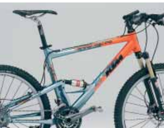
Marathon total KTM Speed Machine

Die Komponenten der in Mattighofen entwickelten Fahrräder werden extern gefertigt, wobei sich Pro/ENGINEER bereits bei zahlreichen Produzenten als leistungsstarkes CAD/CAM-Werkzeug etabliert hat. Der Zusammenbau erfolgt bei KTM Fahrrad. Das Angebot hochwertiger Bikes kommt im Markt an. Allein 2003 produzierte das Unternehmen rund 105.000 Fahrräder und erzielte mit 180 Mitarbeitern einen Umsatz von ca. 50 Millionen Euro.