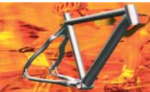
Qualität und Dynamik by KTM